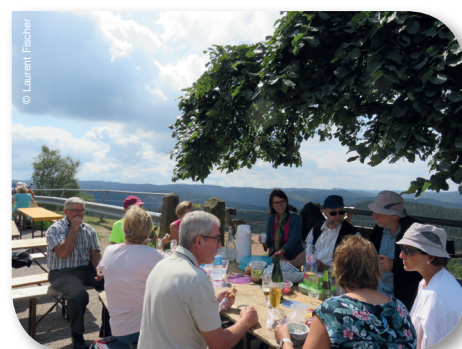
Page 19 - Une dimension sociale.

Ce numéro comporte une enveloppe du CCFD-Terre Solidaire.