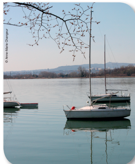
Page 4 - Entendre le clapotis des vagues.